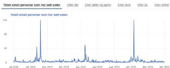
Sidevisninger Facebook viser tydelige topper rundt NM

I perioden 31.10 – 2.11 er det registrert 3.896 sidevisninger og 520 unike brukere som i snitt var inne på siden i tre og et halvt minutt. Under selve arrangementet 1. november gikk lesetiden opp til 6 minutter og 40 sekunder. De aller fleste brukerne var norske, men en del fulgte oppdateringen fra Sverige, og også i Danmark og Finland logget folk seg inn for å følge NM på nett. Sammenlignet med 2018 gikk tallet på brukere og sidevisninger ned med cirka 25 prosent. Det er vanskelig å gi noe sikkert svar på hva nedgangen skyldes, det kan være «nyhetens interesse», men også at markedsføringen av NM-siden var litt bedre i 2018 enn i 2019. Analyser viser at nesten 40 prosent flere kom inn på NM-sida via sosiale medier i 2018 enn i 2019. NM-sida var likevel meget godt besøkt.